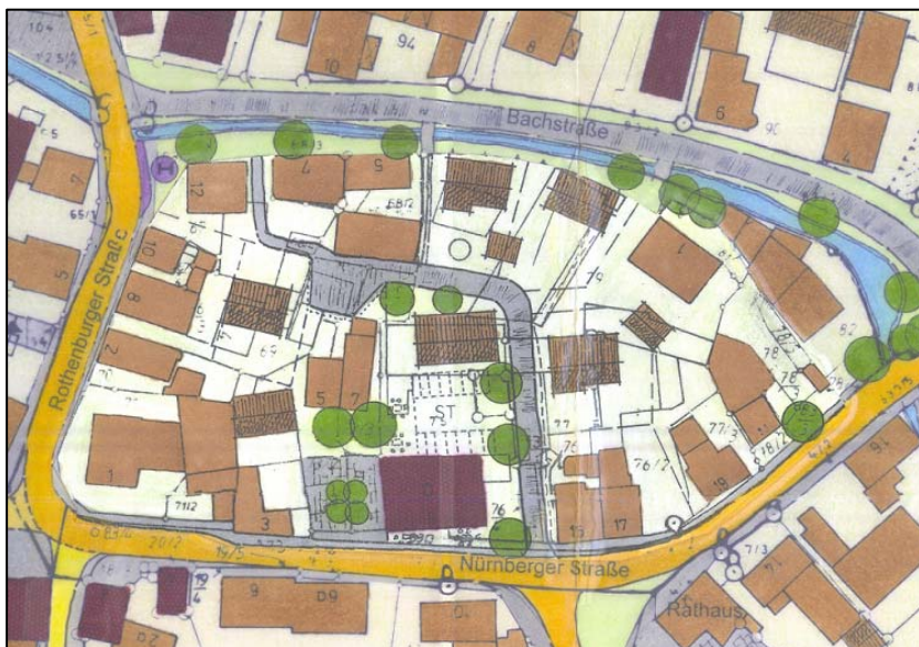
Ausschnitt aus dem Rahmenplan zur Städtebauförderung aus dem Jahr 2001

Land im Rahmenplan zur Städtebauförderung entsprechende Gedanken formuliert. Eine Konkretisierung erhielten die Gedanken, als Grundstückseigentümer Bauwünsche formulierten.